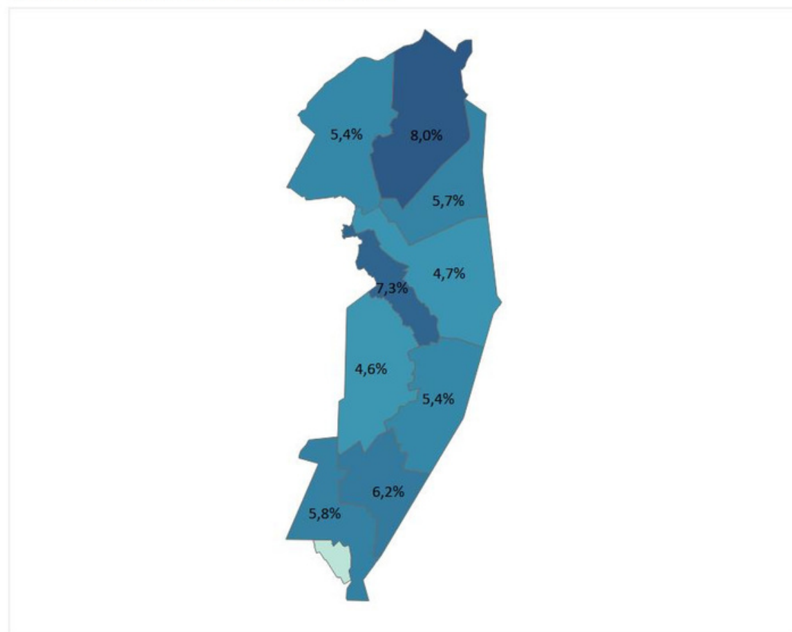
Huishoudens met een laag inkomen (2021)

In de gemeente Westerwolde leven ongeveer 700 huishoudens met een laag inkomen. Bij 300 huishoudens is dit een langdurig laag inkomen. Deze huishoudens moeten 4 jaar of langer op rij rondkomen van een laag inkomen. 300 kinderen in Westerwolde groeien op in een huishouden met een laag inkomen en 100 kinderen langdurig. Het aandeel huishoudens met een laag inkomen is het hoogst in de wijken Bellingwolde, Vlagtwedde en Ter Wisch.