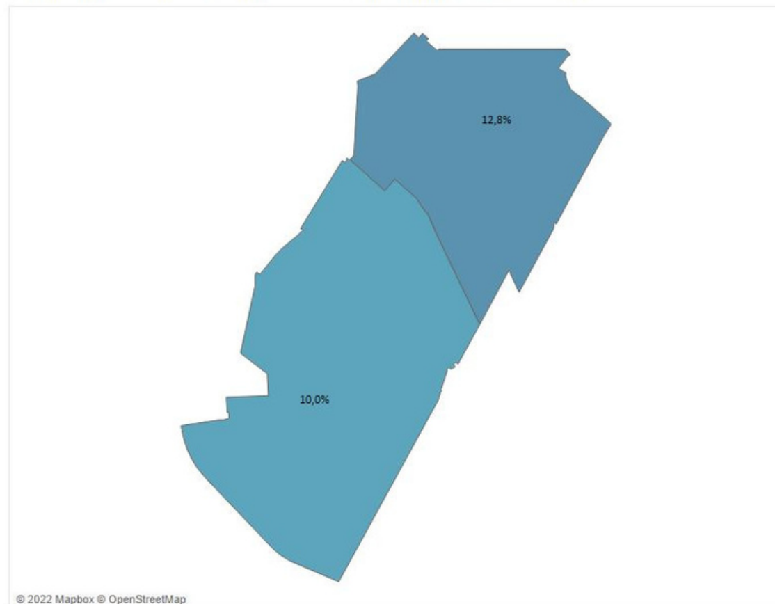
Aandeel huishoudens met geregistreerde problematische schulden (2021)

Mensen in armoede hebben een hoger risico op schulden. 11,6% van de huishoudens in Pekela heeft geregistreerde problematische schulden. Het landelijk gemiddelde van huishoudens met schulden is 7,4%.