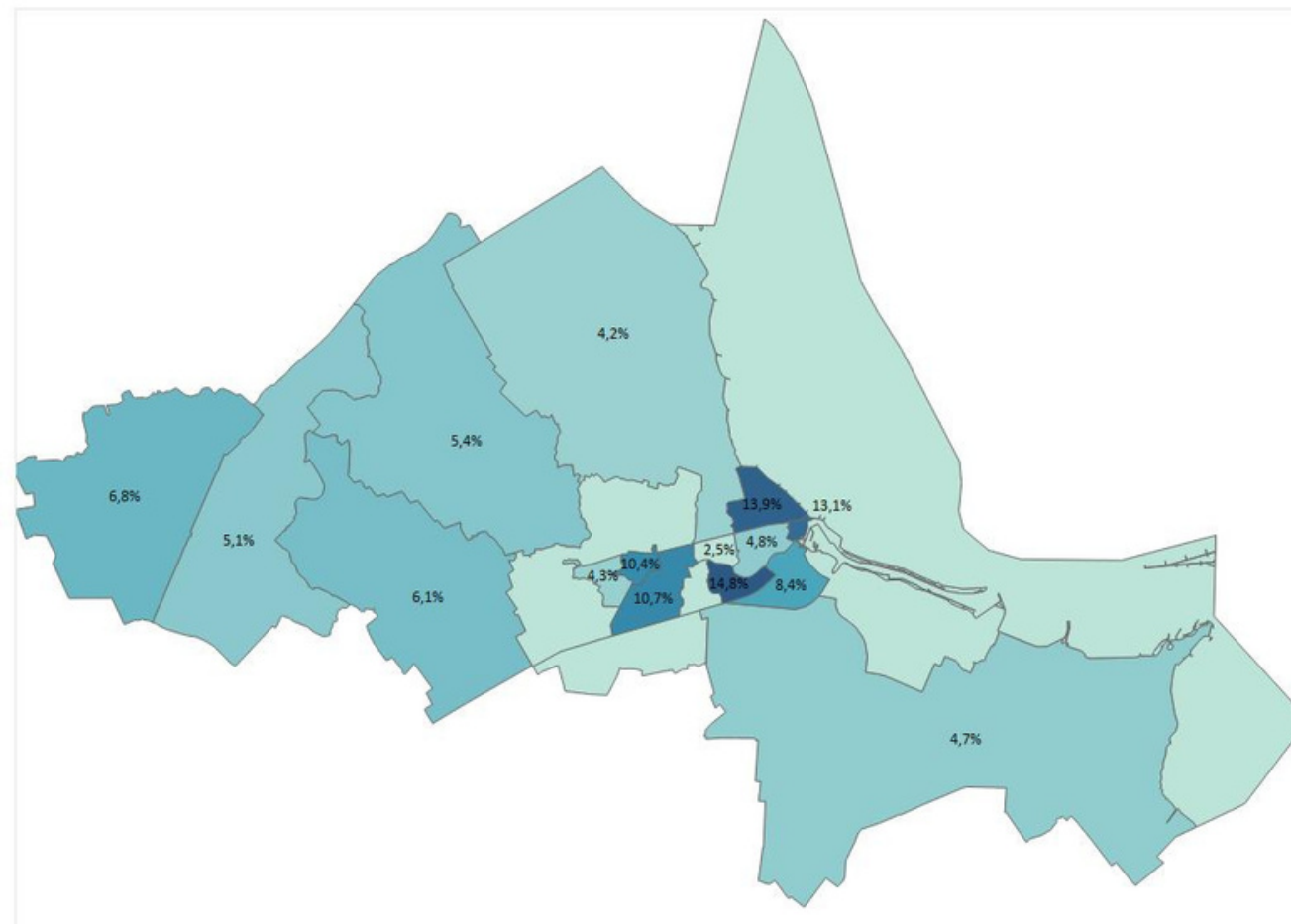
Huishoudens met een laag inkomen (2021)

In de gemeente Eemsdelta leven ongeveer 1.700 huishoudens met een laag inkomen. Bij 800 huishoudens is dit een langdurig laag inkomen. Deze huishoudens moeten 4 jaar of langer op rij rondkomen van een laag inkomen. 800 kinderen in Eemsdelta groeien op in een huishouden met een laag inkomen en 400 kinderen langdurig. Het aandeel huishoudens met een laag inkomen is het hoogst in de wijken Tuikwerd, Noord en Delfzijl-centrum.