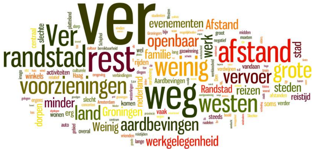
Figuur 2: Nadelen van het wonen in Groningen