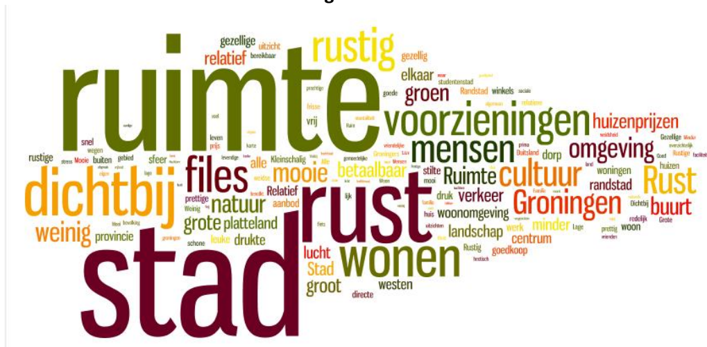
Figuur 1: Voordelen van het wonen in Groningen