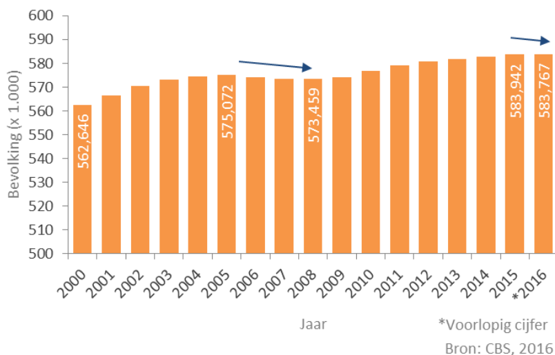
Figuur 1: Omvang bevolking provincie Groningen 2000-2016

Het aantal inwoners in de provincie Groningen is de afgelopen jaren gestaag toegenomen. In 2000 woonden er 562 duizend mensen in de provincie, in januari 2016 waren dit er meer dan 583 duizend. Een toename van ruim 21 duizend inwoners, oftewel 3,8%. Ieder jaar kwamen er in de provincie gemiddeld dus ongeveer 1.400 inwoners bij. Dat is ieder jaar het aantal inwoners van een dorp ter grootte van bijvoorbeeld Usquert, De Wilp, of Nieuweschans. Deze toename van de Groningse bevolking blijft wel achter bij het landelijke groeicijfer van de bevolking van 6,5% sinds 2000. De volgende figuur geeft laat zien hoe de Groningse bevolking zich sinds 2000 ontwikkeld heeft.